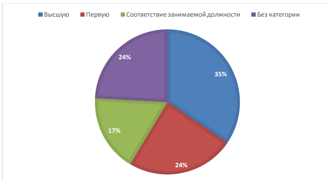
Рисунок 5. Квалификация штатного педагогического состава

Базовое образование всех преподавателей соответствует профилю преподаваемых дисциплин.