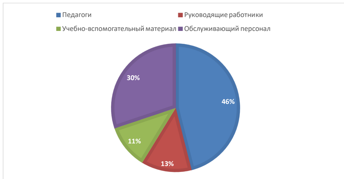
Рисунок 4. Кадровый состав техникума

Численность штатных сотрудников техникума на 31 декабря 2025 года составило 63 человек. Структура кадрового состава представлена на рисунке 5.