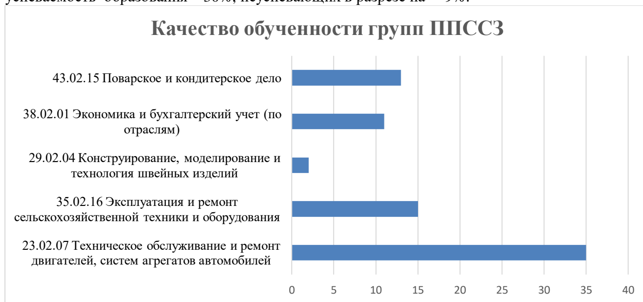
Рисунок 1. Качество обученности групп ПССЗ

Таким образом, можно сделать вывод, что успеваемость студентов по программам подготовки специалистов среднего звена за 2025 учебный год составляет 91%, качественная успеваемость образования – 30%, неуспевающих в разрезе на – 9%.